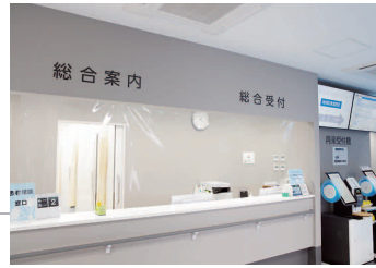
総合案内・総合受付