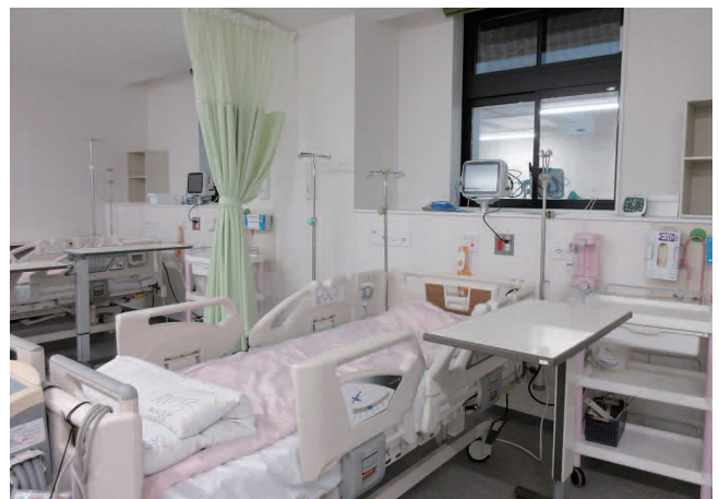
H C U