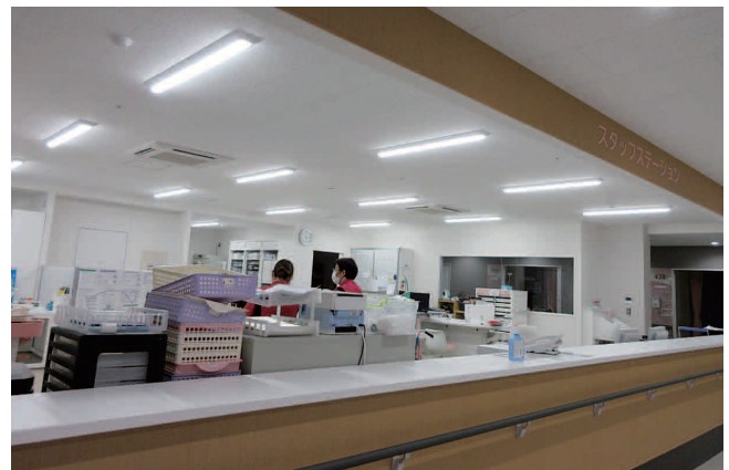
ナースステーション