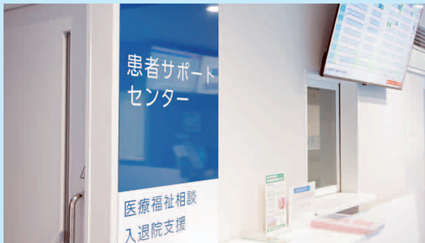
患者サポートセンター (医療福祉相談・入退院支援)