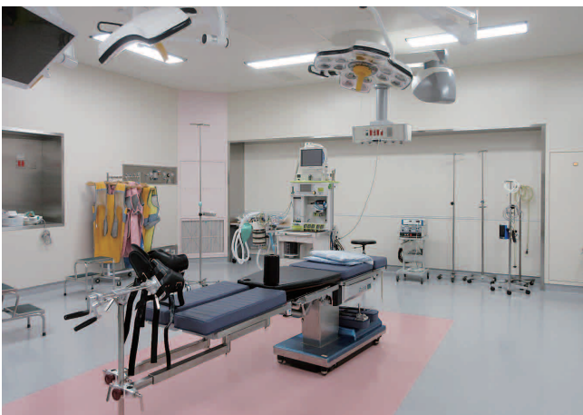
手 術 室