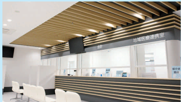
会計窓口・地域医療連携室