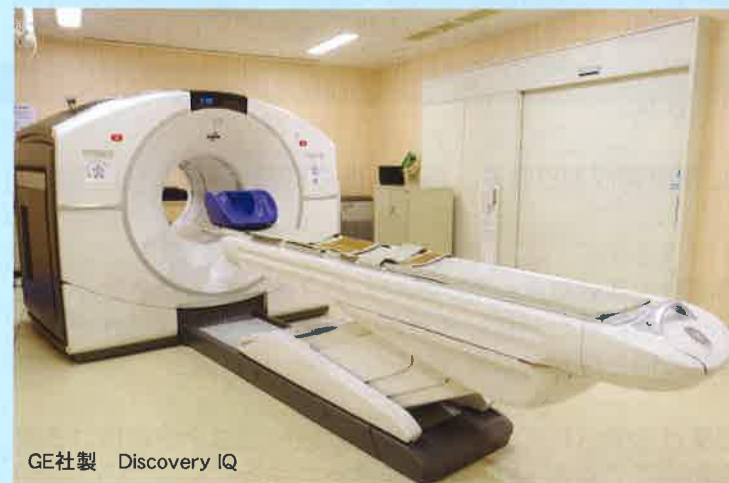
GE社製 Discovery IQ

平成19年3月に東予地区で初めて導入されたPET-CTを、令和3年3月に更新しました。