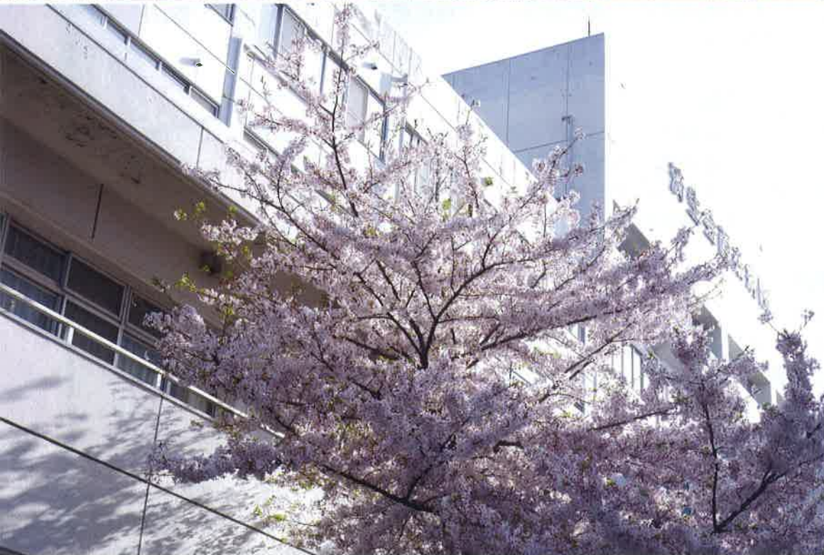
病院中庭に咲く桜