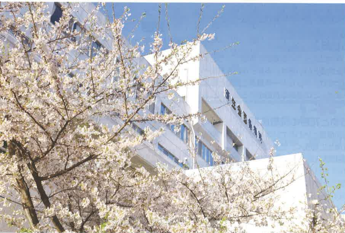
当院中庭の桜