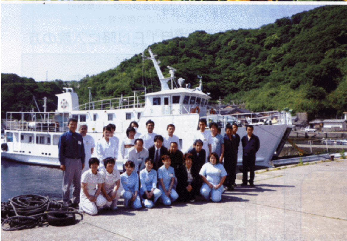
瀬戸内海巡回診療船「済生丸」